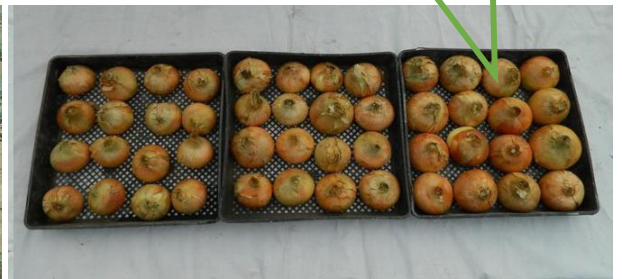
Control Competitor Rhizone